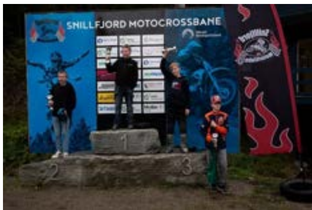
MX85 13-15 år

Lørdag 30. september arrangerte Snillfjord motorklubb klubbmesterskap i motocross. Stor deltakelse med hele 63 kjørere, både jenter og gutter.