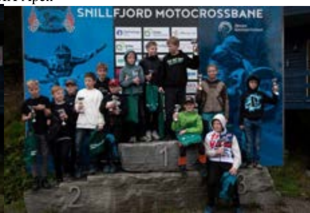
MX 85 rekrutt