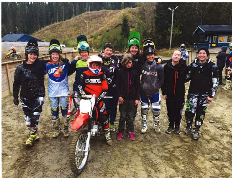
Hele 10 jenter kjørte på treningen 1. oktober, det er ny rekord.