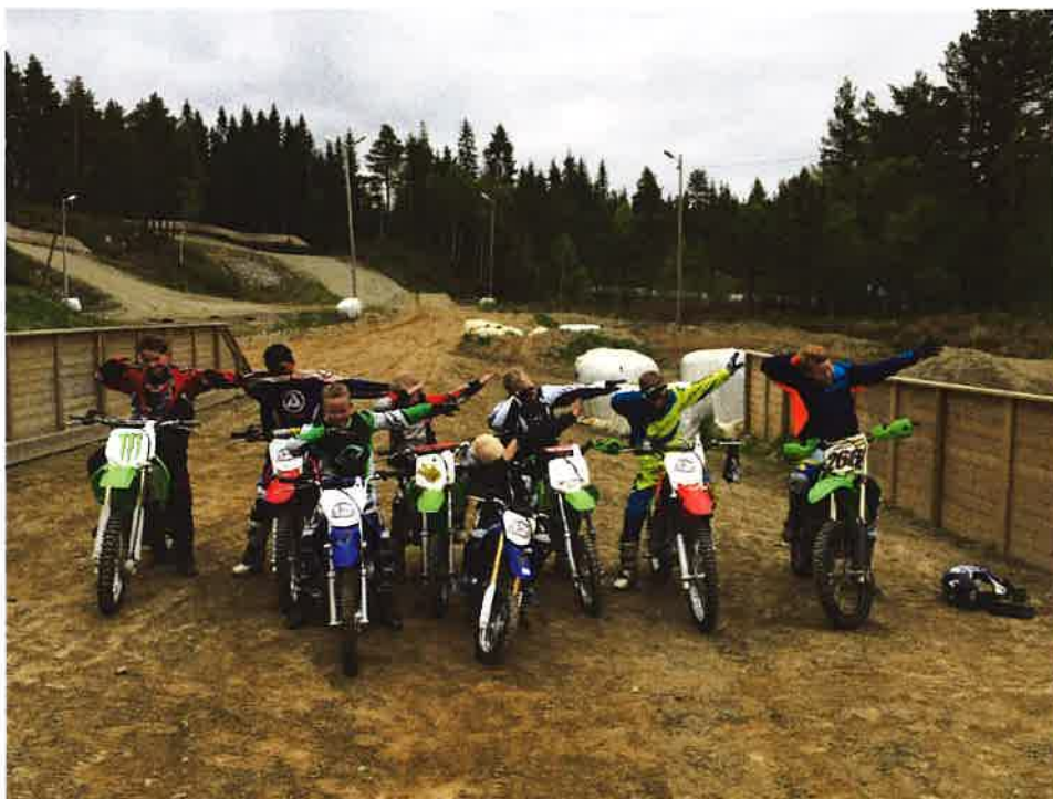
Her er en fornøyd gjeng under nybegynnerkurs 21. mai.

Denne satsningen har blitt godt mottatt, og senker terskelen betraktelig for å kunne prøve motocross. Det ble mot slutten av sesongen i tillegg stor etterspørsel etter utleiesykler til ungdom og voksne. På slutten av sesongen tok dette helt av, og spesielt søndag etter klubbmesterskap. Da var det 10 nye førere som kjørte motocross for første gang. Og ekstra moro at hele 10 jenter kjørte på samme trening. Dette ga oss et kick for å legge forholdene enda bedre tilrette for neste sesong.