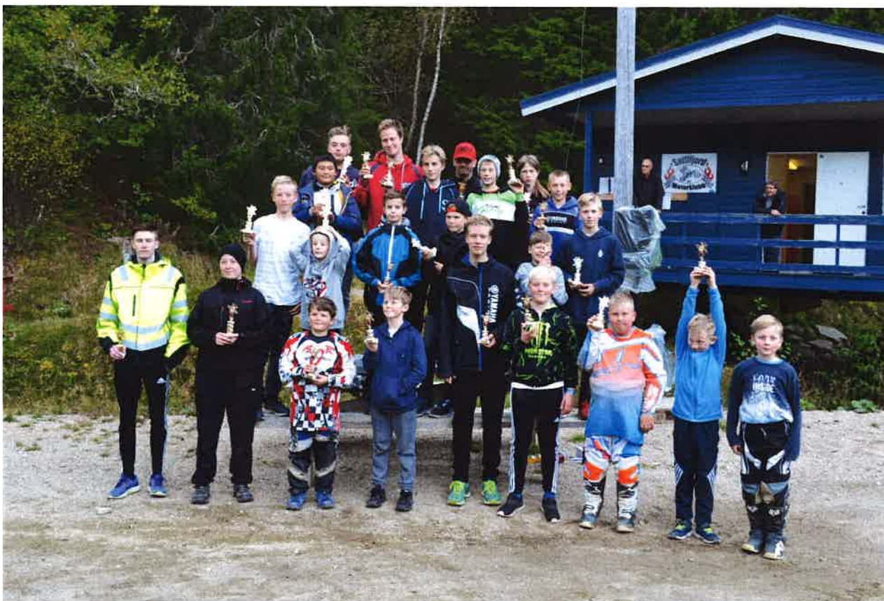
Bildet viser deltakerne på klubbmesterskapet 30. september

Lørdag 30. september arrangerte Snillfjord motorklubb klubbmesterskap i motocross. 23 kjørere, både jenter og gutter, deltok i løpet. Dette er andre gang vi arrangerte et klubbmesterskap med kun egne medlemmer. I MX barn deltok 12 kjørere i alderen 6-11 år. I MX 85 var det 6 kjørere i alderen 13-15 år. I MX125/250 var det 5 kjørere i alderen 16 til 42 år. Og i MX damer var det en deltaker. Etter endt kjøring var det felles grilling av hamburgerer rundt langbord i ventesonen. Vi var heldige på få besøk av journalist fra Avisa Sør-Trøndelag på løpet. Dette resulterte i en dobbelside i avisa med mye positiv omtale av klubben og våre aktiviteter☺